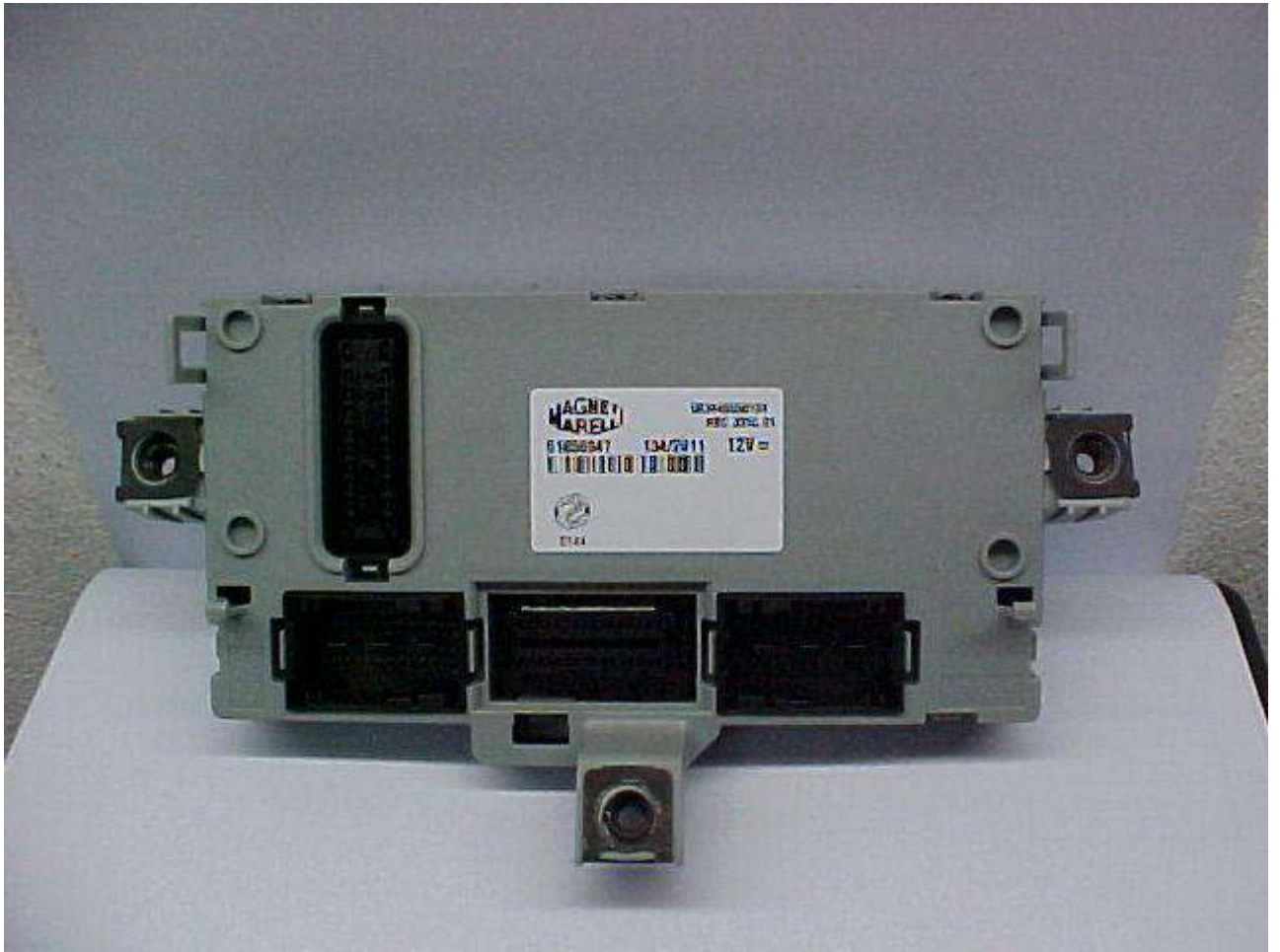
FIAT BRAVO 2011 - CODIFICAÇÃO 112 - CRIAÇÃO COM O CHIP T-19 USAR CABO 8 VIAS