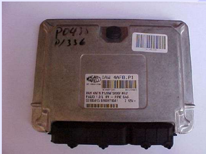
Central Fiat Magneti Marelli IAW 4AFB.P1 Fechada