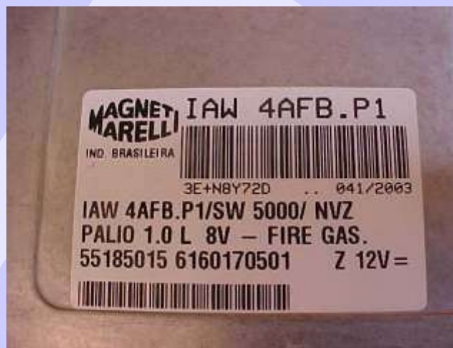
Localização da memória a ser programada na Central Fiat Magneti Marelli IAW 4AFB.P1