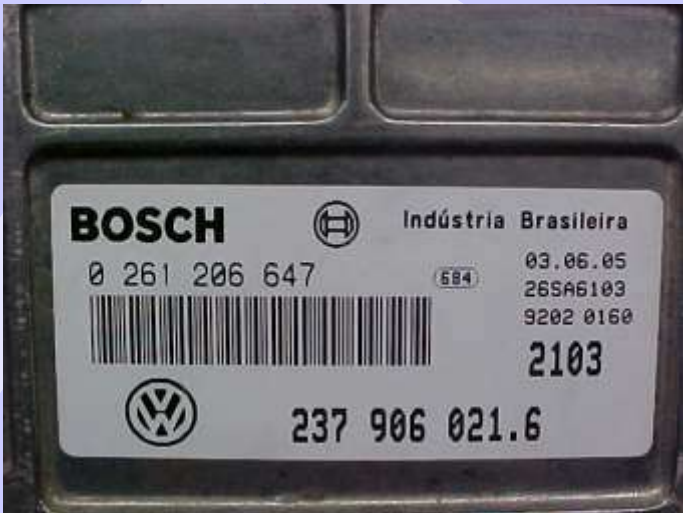
Etiqueta de Identificação da Central Bosch Motronic MP 9.0