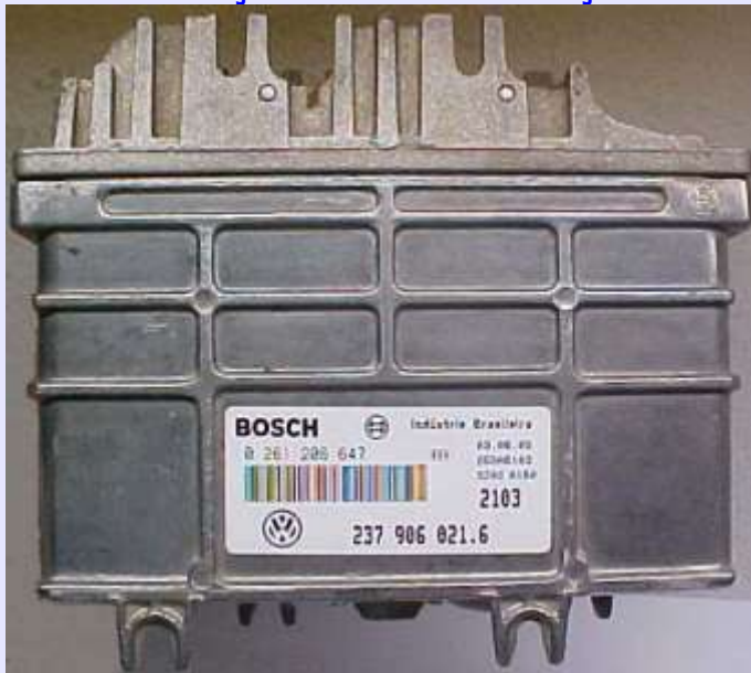
Central Bosch Motronic MP 9.0 Fechada