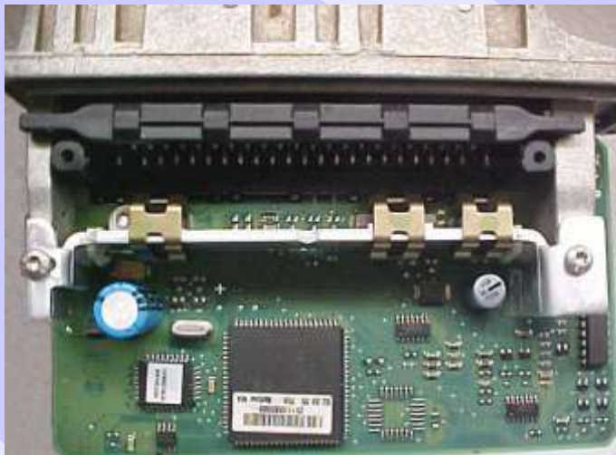
Central Bosch Motronic MP 9.0 aberta visualizando a Placa de Circuito