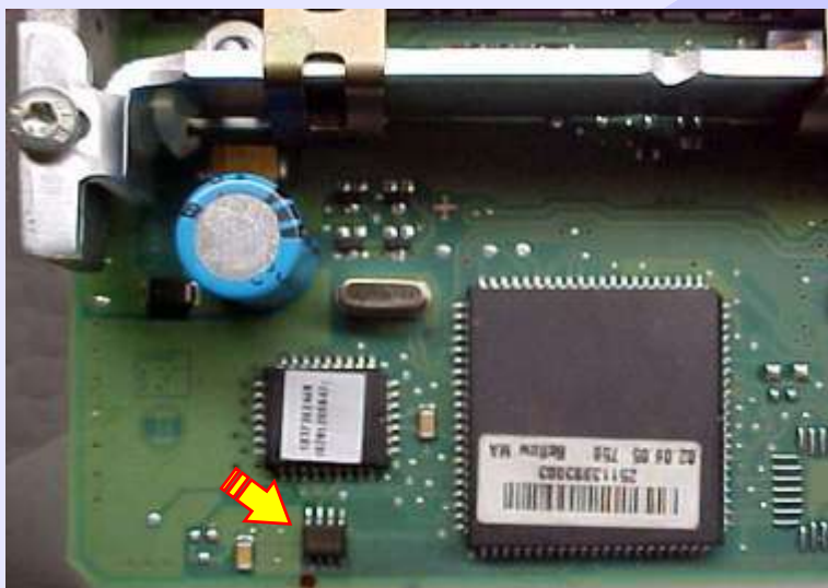
Localização da Memória SMD (24C02) na Placa de Circuito da Central Bosch Motronic MP 9.0