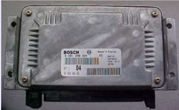
Central Bosch Motronic 7.2 fechada