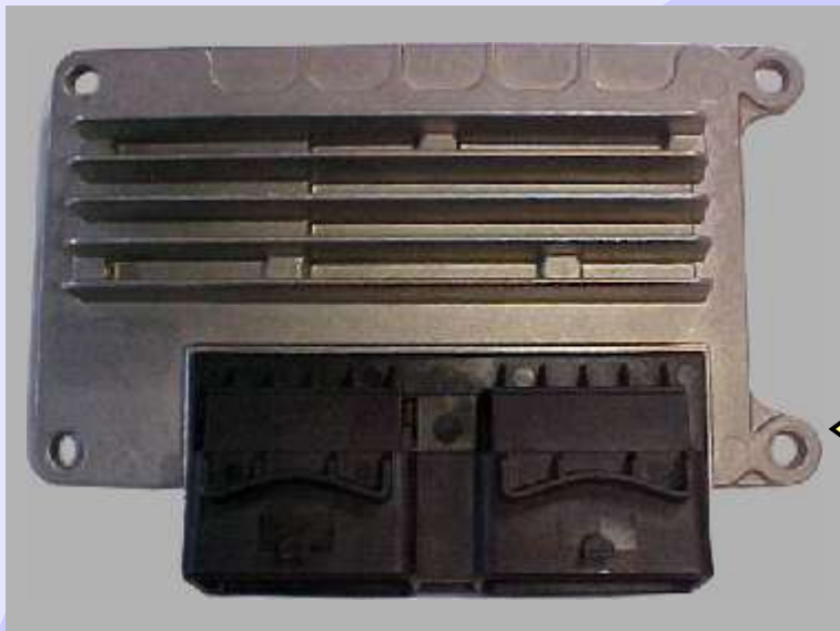
Tampa da Central Magneti Marelli IAW 5NP2