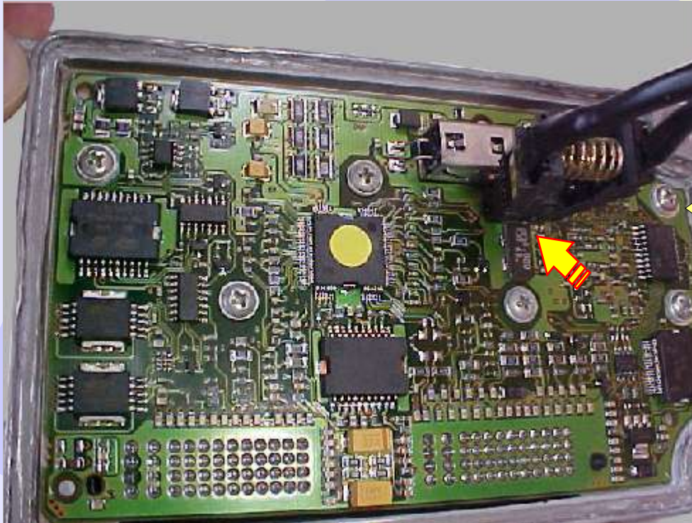
Aplicação da Pinça Soic 8