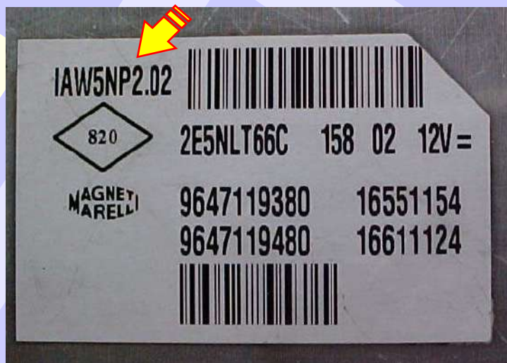
Identificação da Central Magneti Marelli IAW 5NP2