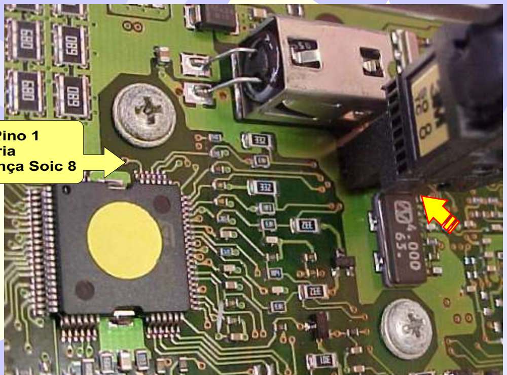
Posição do Pino 1 da memória ao ser usada a Pinça Soic 8