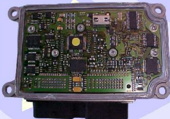
Placa de Circuito da Central Magneti Marelli IAW 5NP2