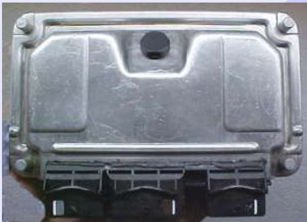
Central Bosch Motronic ME 7.4.4 fechada