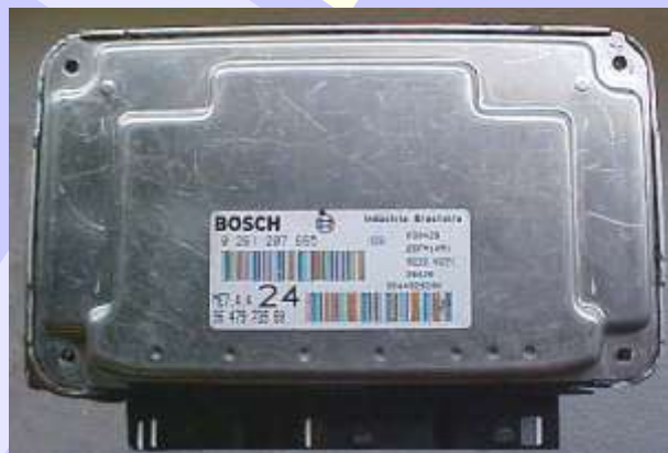
Etiqueta de Identificação da Central Bosch Motronic ME 7.4.4