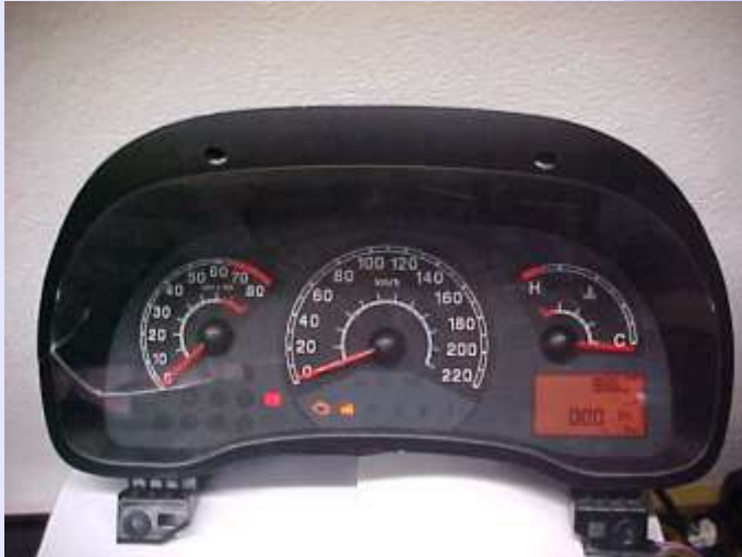
Painel Siemens 24C16