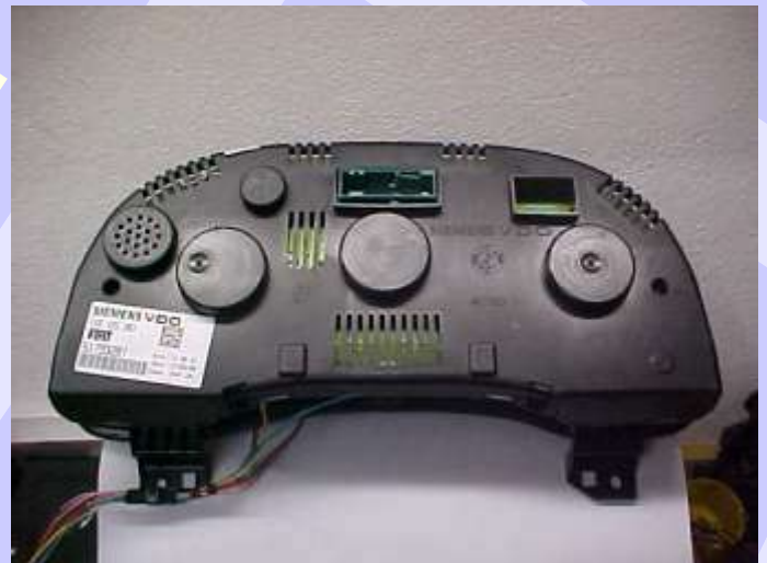
Parte Traseira Painel Siemens 24C16