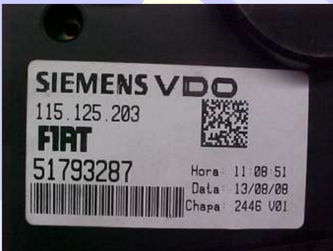
Etiqueta de Identificação do Painel Siemens 24C16