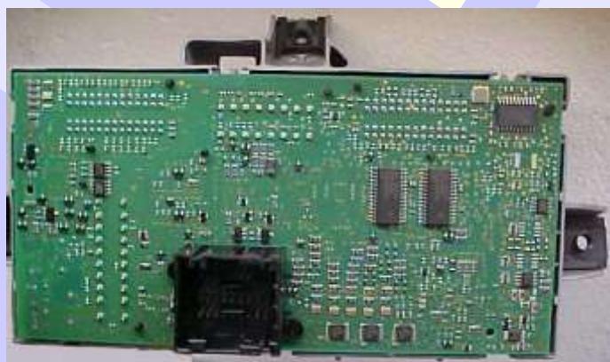
Visualização do Circuito do Body Computer