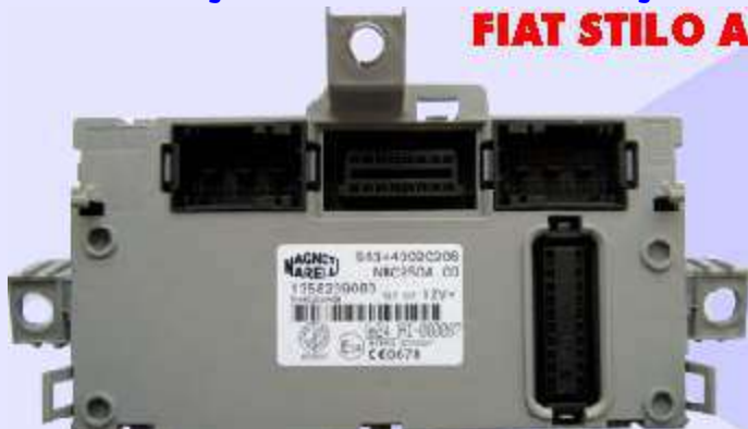
Body Computer Fechado