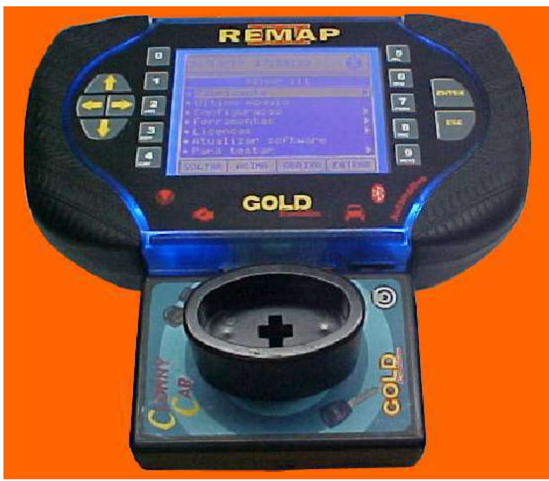
ILUSTRAÇÃO DO CLONNY CAR E TRANSPONDER MEGAMOS ACLOPAMENTO AO REMAP III

NOTA: Para trabalhar com o Clonny Car e Pinça, tem que está ligado na fonte de alimentação.