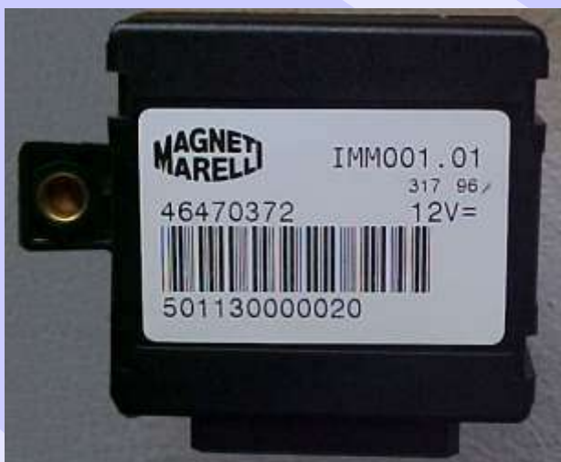
Imobilizador Magneti Marelli 46470372