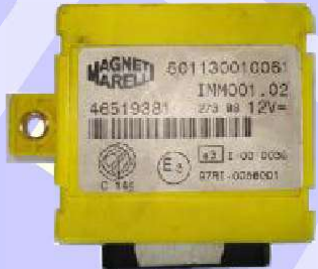
Imobilizador Magneti Marelli 46519381