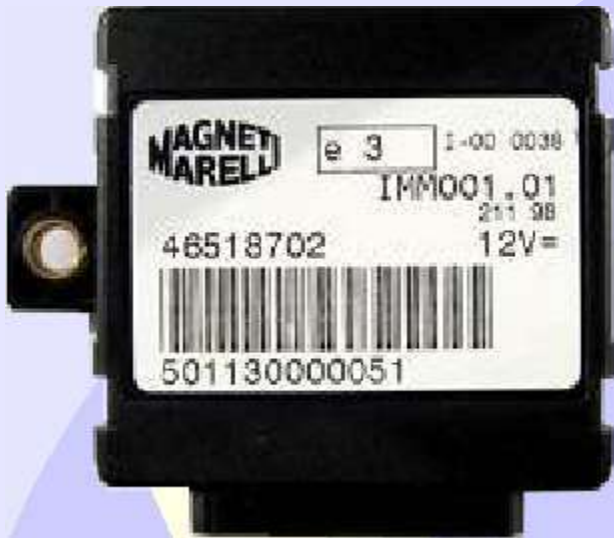
Imobilizador Magneti Marelli 46518702