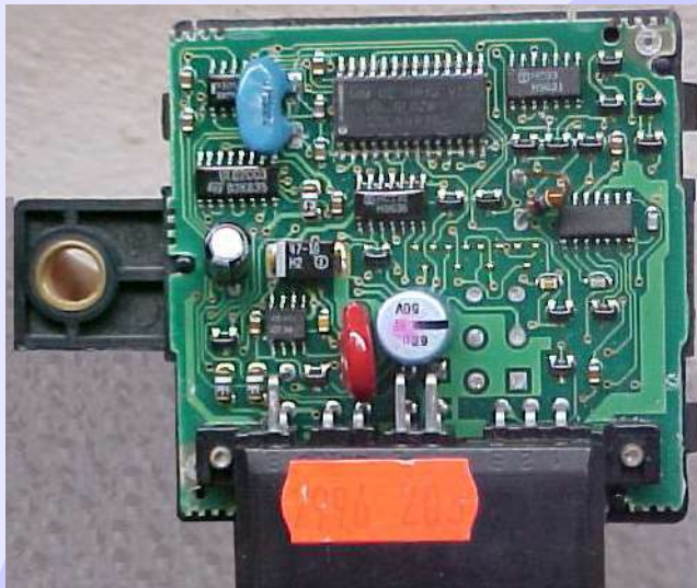
ILUSTRAÇÃO DA VISUALIZAÇÃO DO CIRCUITO E LOCALIZANDO O MICROPROCESSADOR ONDE SERÁ APLICADO A PINÇA PARA LER CHAVES E RESET

Visualizando o circuito do Imobilizador neste caso o modelo 46470372