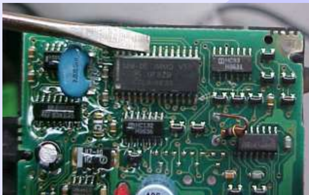
ILUSTRAÇÃO DA PREPARAÇÃO DO MICROPROCESSADOR PARA LER CHAVES E RESET VIA PINÇA

Utilizando a chave de fenda para limpeza das pernas do Microprocessador , para melhorar o contato da Pinça Soic 8