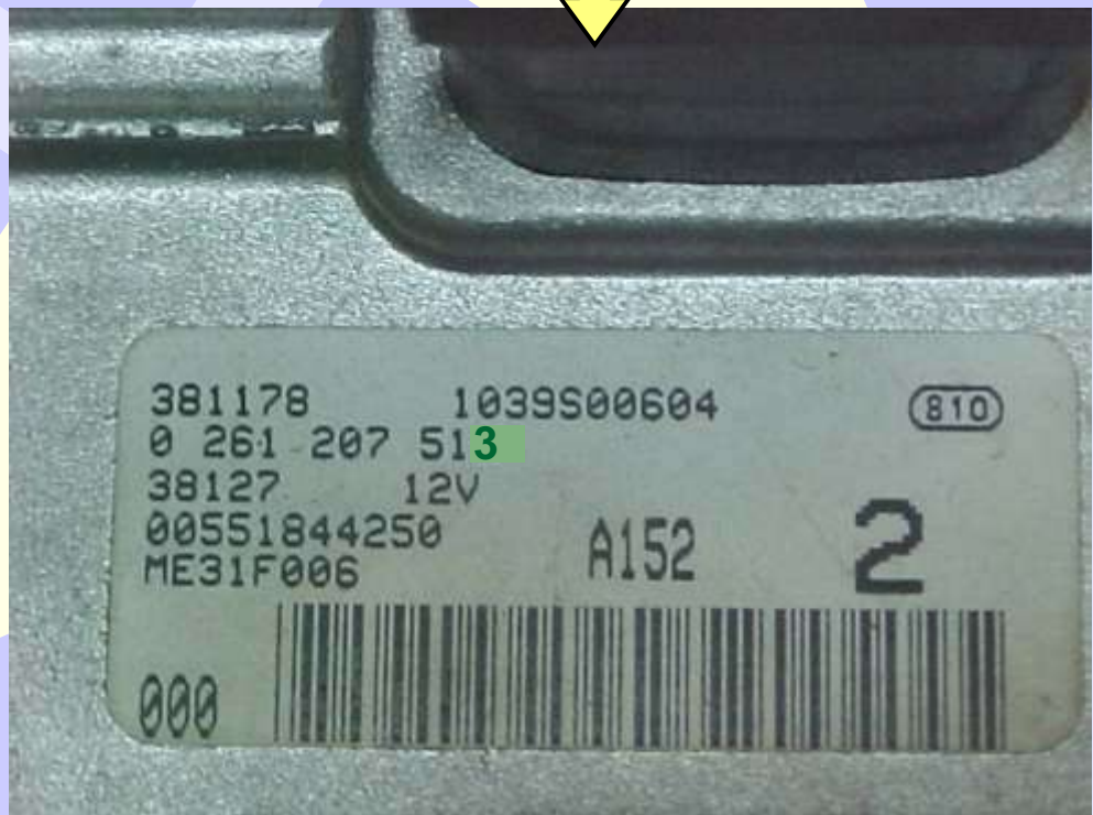
Etiqueta de Identificação da Central Híbrida Bosch ME 3.1 513 0261 207 513