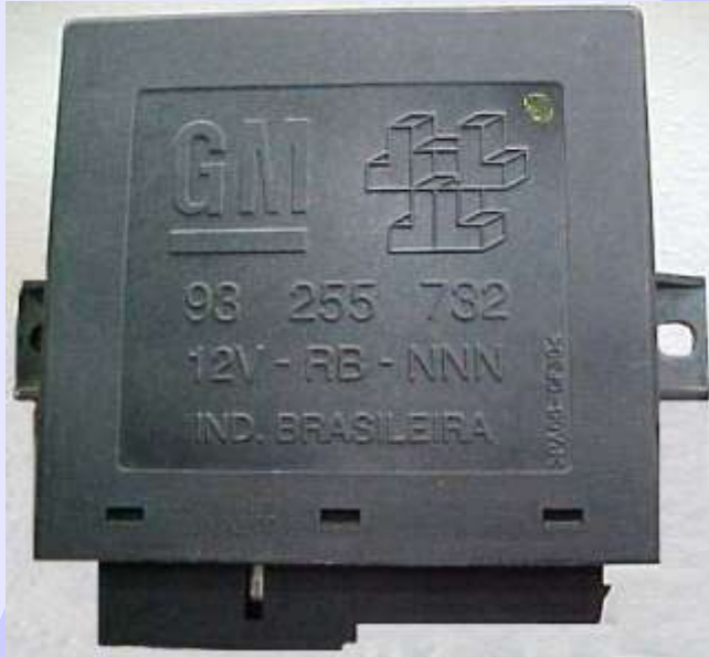
Alarme 93255732 / 93255733