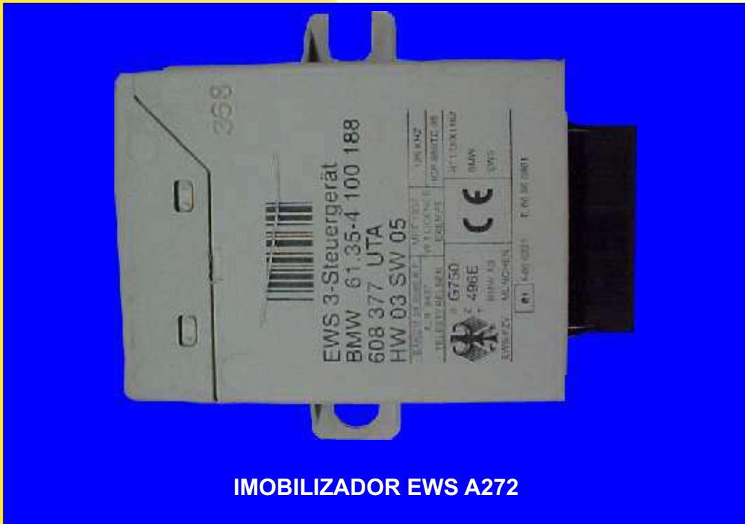
IMOBILIZADOR EWS A272